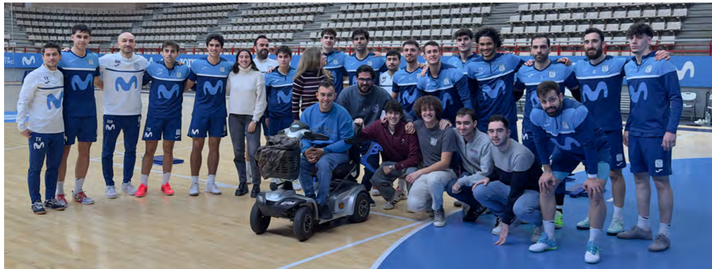
Pablo por la banda de la pista del pabellón Luis Pérez Canca donde se jugó la 4ª eliminatoria de Copa del Rey

¡Movistar Inter FS sigue atrayendo el interés de todos los fanáticos del deporte!